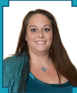
Tara Anderson Elementary Parent Commissioner